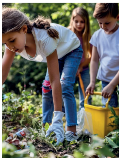
Réalisé avec freepik.com - 6m images

Je suis sensible à l'environnement à la préservation des espèces, aux jeunes en situation de handicap.